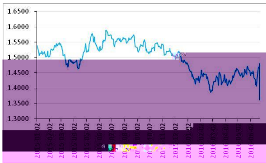
数据来源：Wind 广州期 所